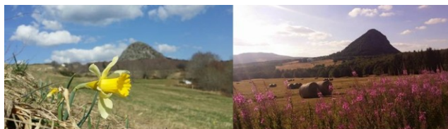
Les 4 saisons du Mont Gerbier de Jonc